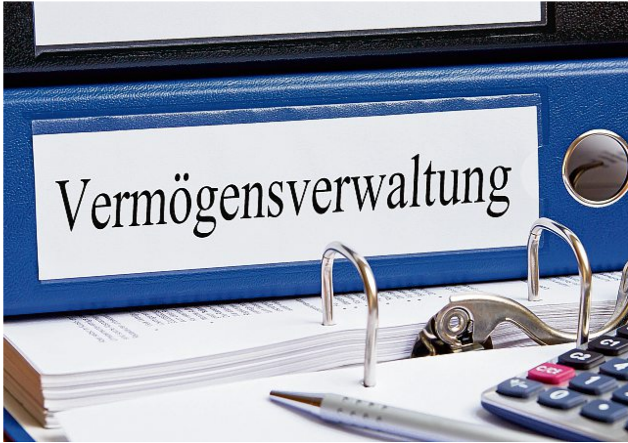
Hier geht es um die Verwaltung von Einkommen und Vermögen sowie die Abwicklung des Zahlungsverkehr.

Erstens die Personenvorsorge: Hier stehen Entscheide über medizinische Massnahmen im Zentrum, falls keine Patientenverfügung vorliegt; ferner die pflegerische Behandlung sowie Hilfe für das persönliche Wohl im Alltag. Zweitens die Vermögensvorsorge: Hier geht es um die Verwaltung von Einkommen und Vermögen sowie die Abwicklung des